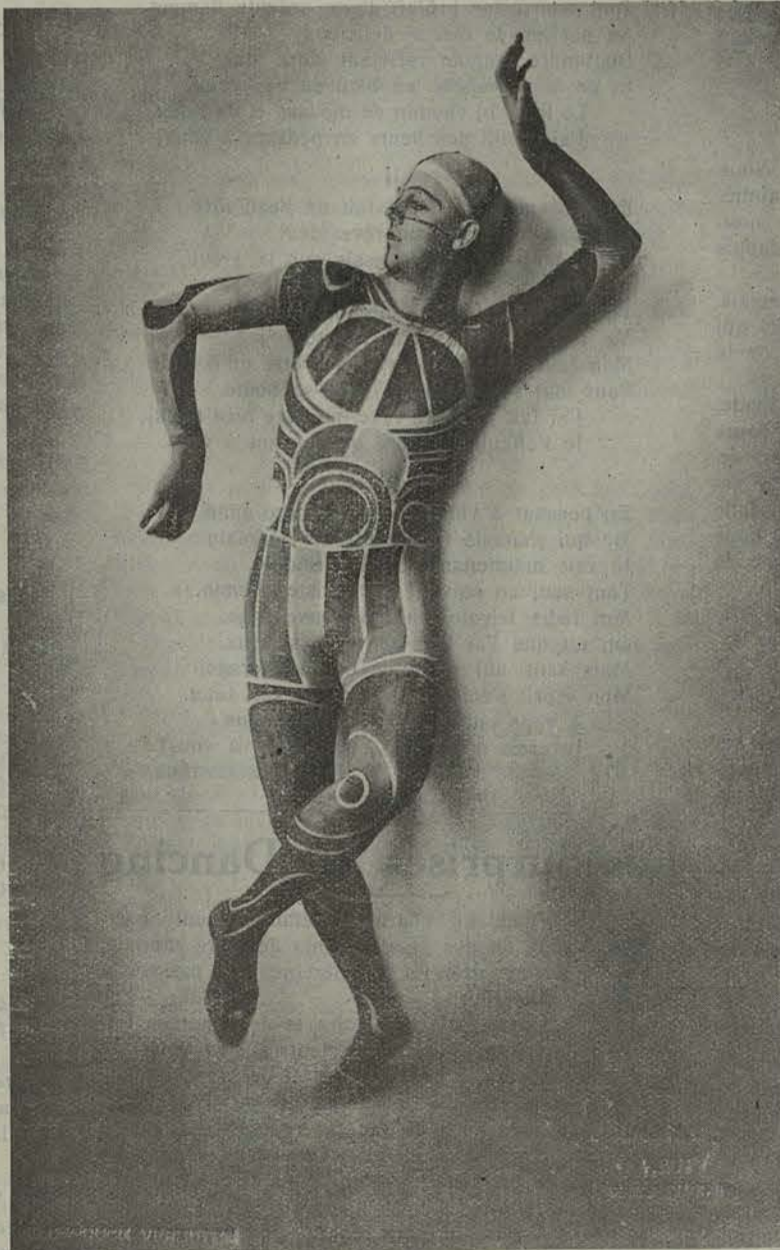
M. JEAN BORLIN

Mais pourquoi profiter de cela pour brutaliser la danse une fois de plus? Au cours d'un long voyage, toutes les distractions ne sont-elles pas bonnes? Les uns aiment lire, les autres dorment... quel crime commettent encore ceux qui dansent? En général, ceux qui ont ce qu'ils désirent ont la critique facile et en cela ils manquent de générosité. J'ai vu maintes fois des gens jouer au bridge en wagon et tromper ainsi leur impatience: j'en aime pas le jeu, mais je leur ai donné raison quand même. Eh bien, croyez-moi, les amateurs de danse seraient charmés de vivre sous le même régime de liberté, pensant avec juste raison que chacun a le droit